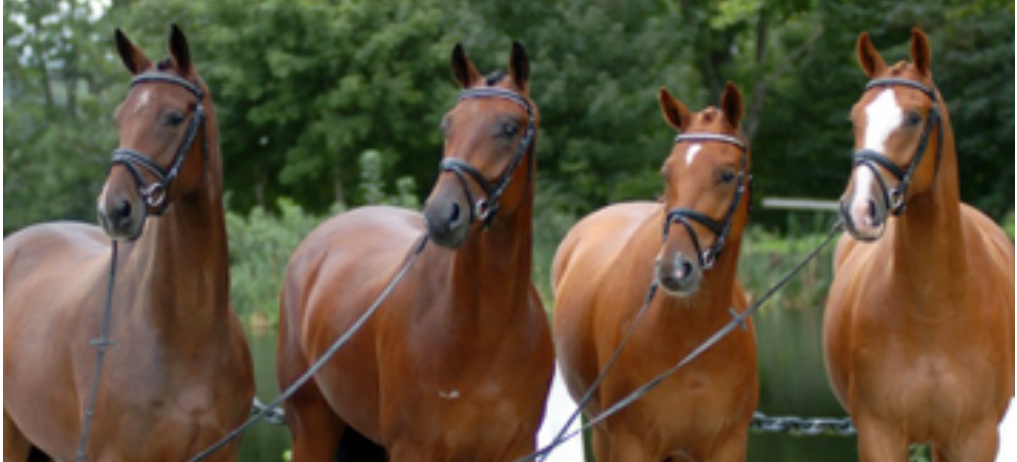
Bollerup har under flera år varit Sveriges största varmbloodstuteri.