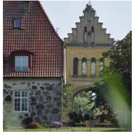
Flyinge Kungsgård är en av hästnäringens tre riksänlaggningar. Här möter historiens vingslag modern hästhållning och högklassiga ridsportevenemang.